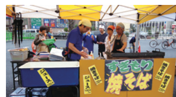
9月7日(日) 「第1回調布まち活 フェスタ」に地区協 委員有志で参加

すぎもり地区協議会は、杉森小学校地域に暮らす全ての人々や活動する団体が相互に協力し、支え合い、絆を深め、地域の課題を地域全体で考え、安全・安心を守り、豊かで活気あるまちづくりを目指すことを目的として、本年2月に設立いたしました。