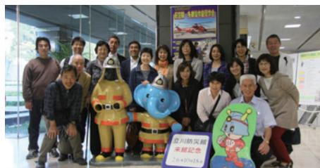
大変有意義な体験でした！

すぎもり地区協議会設立より半年余りすぎ、2番目に選んだ行事が立川防災館での体験学習です。3時間ほどでこれだけ多くの体験が出来たのはとても貴重な経験でした。地域の多くの方が体験する事で地域の財産になります。自助・共助・公助の精神で、すぎもり地区協議会を発展していけたらと思います。